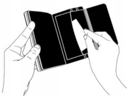
KIESZEŃ NA DOKUMENTY