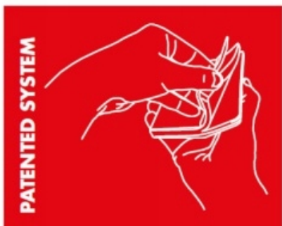
TWARDA, ELASTYCZNA OKŁADKA